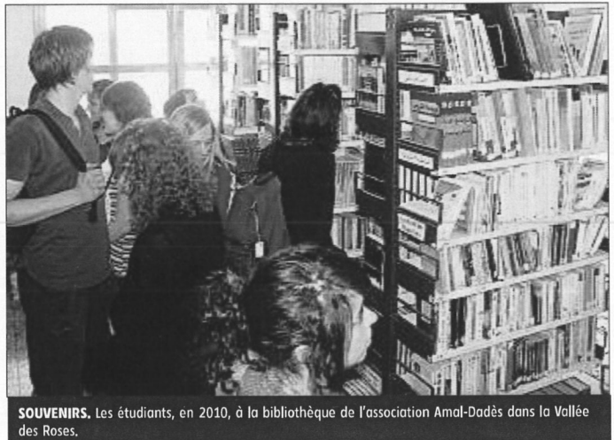
SOUVENIRS. Les étudiants, en 2010, à la bibliothèque de l'association Amal-Dadès dans la Vallée des Roses.

Ce circuit des villes impériales, préparé par les étudiants du BTS Commerce International, leur a permis de mettre en pratique les acquis théoriques de la formation. La prise d'initiatives, la gestion de groupes, l'ordonnement des tâches, la recherche documentaire, les techniques de communication et de négociation à l'international, ont amené les étudiants à se rendre compte réellement des